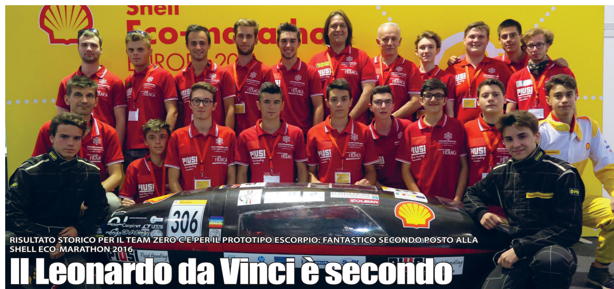
RISULTATO STORICO PER IL TEAM ZERO C E PER IL PROTOTIPO ESCORPIO: FANTASTICO SECONDO POSTO ALLA SHELL ECO-MARATHON 2016